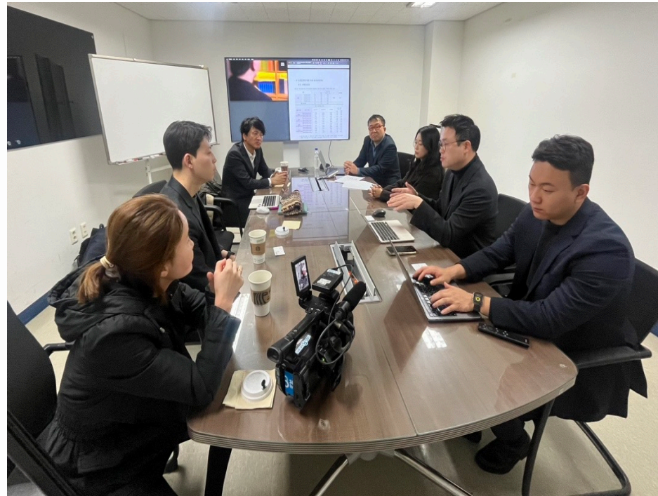
SBS 조동찬 의학전문기자·신용식 기자 본사 방문