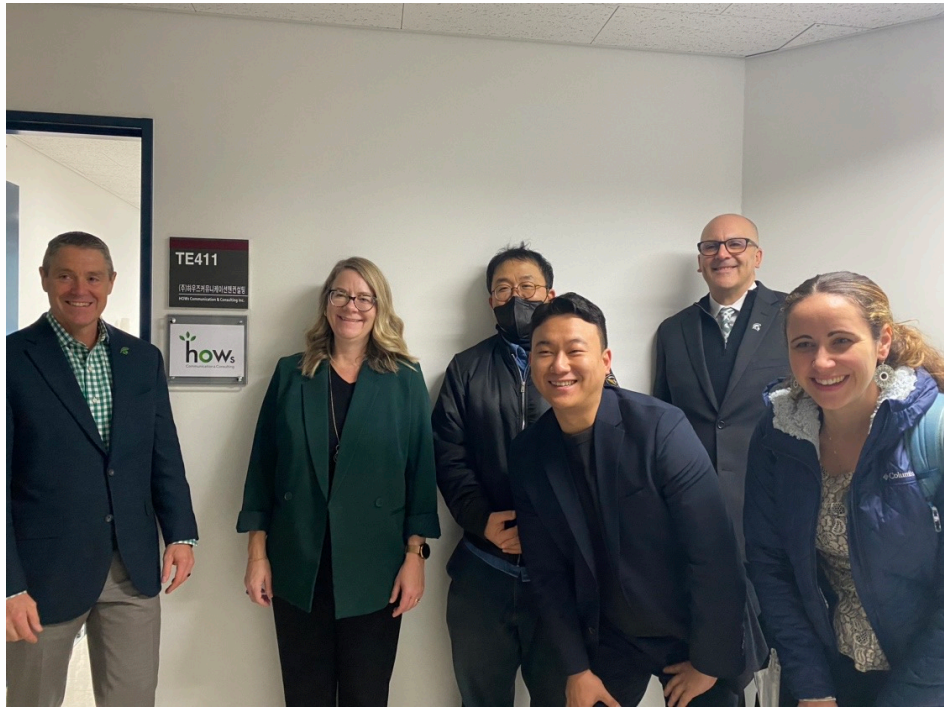
미국 Michigan State University 연구팀 본사 방문